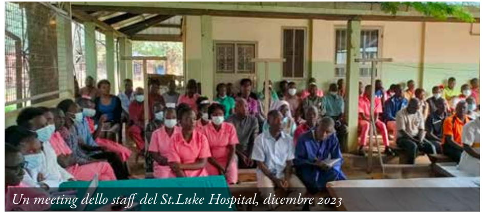
Un meeting dello staff del St.Luke Hospital, dicembre 2023