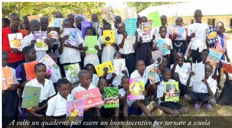
A volte un quaderno può essere un buon incentivo per tornare a scuola

Il 5 febbraio è iniziato il nuovo anno scolastico per i piccoli studenti dell'Asilo St. Theresa ed i compagni più grandi della Primary School di Angal. Ad attenderli 150kg di materiale scolastico di ogni tipo arrivato ad Angal, a gennaio, mediante container.