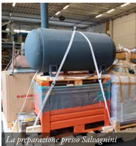
La preparazione presso Salvagnini