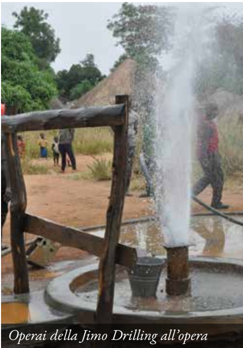
Operai della Jimo Drilling all'opera

Cinque pozzi del Distretto di Nebbi, nell'area circostante l'ospedale di Angal, sono in ripristino grazie al cofinanziamento della Regione Veneto. L'obiettivo? Facilitare l'accesso ad acqua pulita e sicura a 3.400 persone.