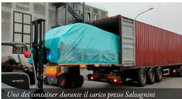
Uno dei container durante il carico presso Salvagnini