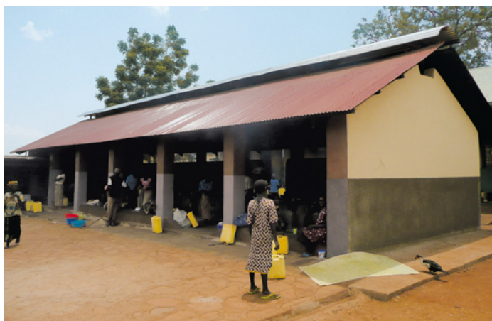
I nuovi shelters, dove albergano i parenti dei pazienti.