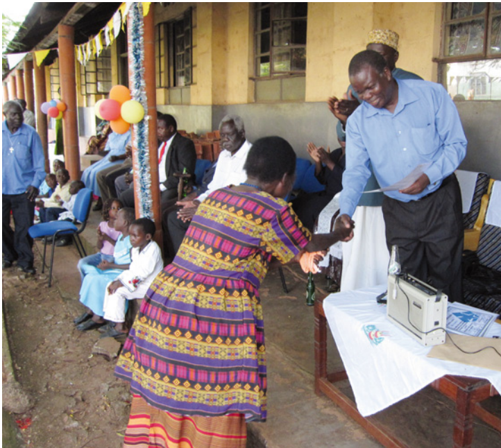
Premiazione dei dipendenti anziani dell'Ospedale.