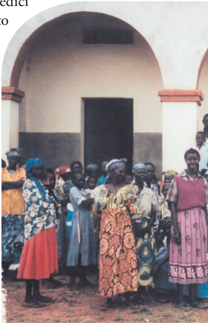
La "nostra gente" di Angal.

Concludo riportando la frase conclusiva di una e-mail che questi medici ugandesi mi hanno inviato alcuni giorni fa: "Grazie per quello che fate per la nostra gente".