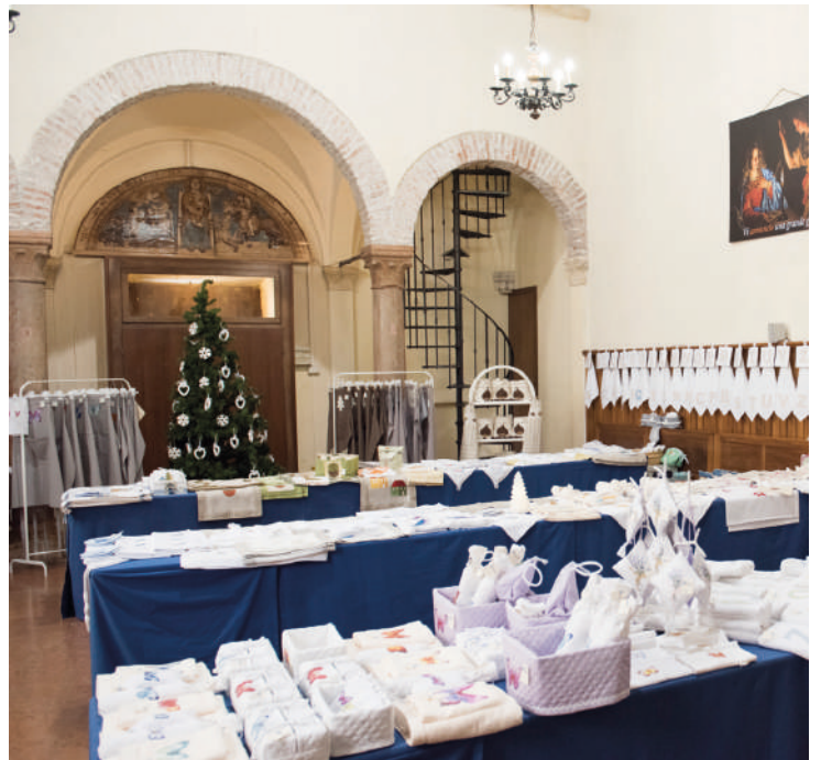
Sopra: le opere di Mimina e le sue amiche esposte nella Chiesa di S. Pietro. Sotto: conoscenza (a distanza!) tra Amici di Angal ed i ragazzi di Abu Dhabi prossimi alla cresima