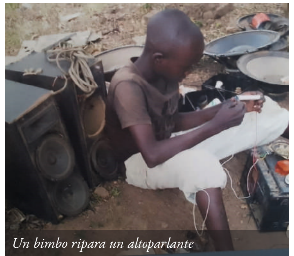
Un bimbo ripara un altoparlante