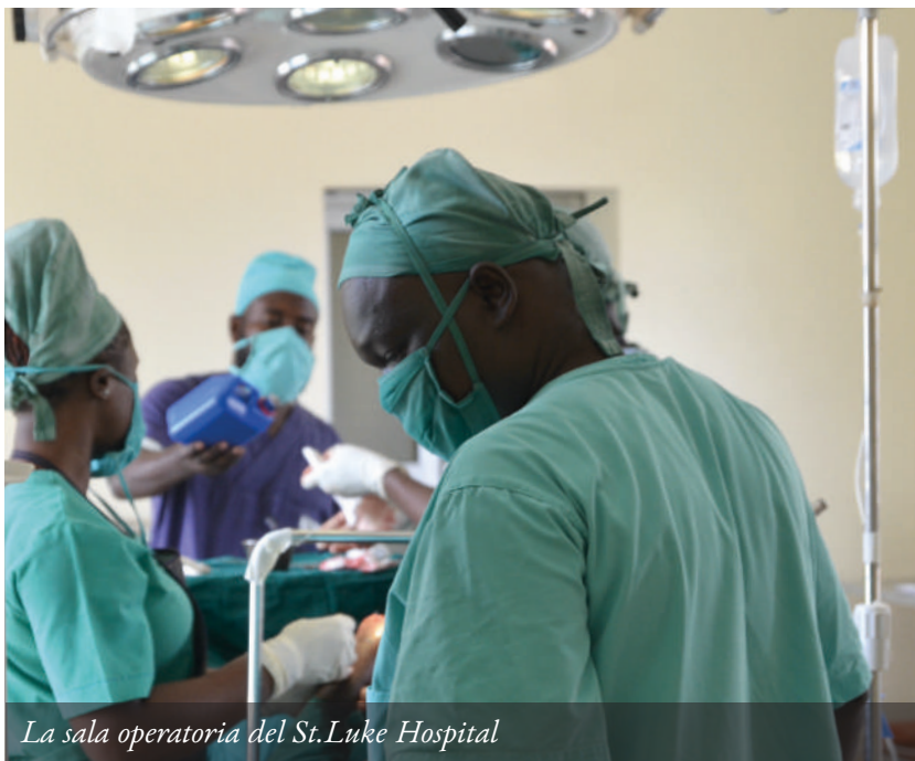
La sala operatoria del St. Luke Hospital