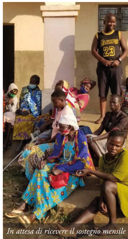
In attesa di ricevere il sostegno mensile

ze agricole e di strumenti, restano dipendenti dalle famiglie adottive. Vengono inclusi nel progetto didattico ambientale "Fattoria Cardellino", per fornire loro formazione tecnico-pratica, avviandoli così al mondo del lavoro e all'indipendenza.