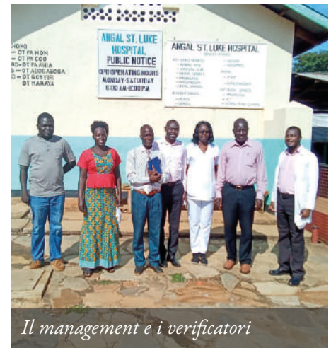
Il management e i verificatori

Poiché Amici di Angal finora è riuscita a raccogliere intorno a questo progetto € 150.000 , per il momento può dare all'ospedale solo il 42% della cifra da esso “guadagnata”. Non è tutto, ma è comunque un buon aiuto e l'ospedale lo apprezza.