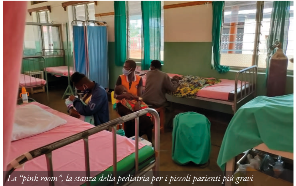
La "pink room", la stanza della pediatria per i piccoli pazienti più gravi

Nell'ultima pagina del Modello 730, Modello Redditi o della Certificazione Unica (CU) inserisci il codice fiscale 93143850233 e apponi la firma . Il tuo contributo ci arriverà.