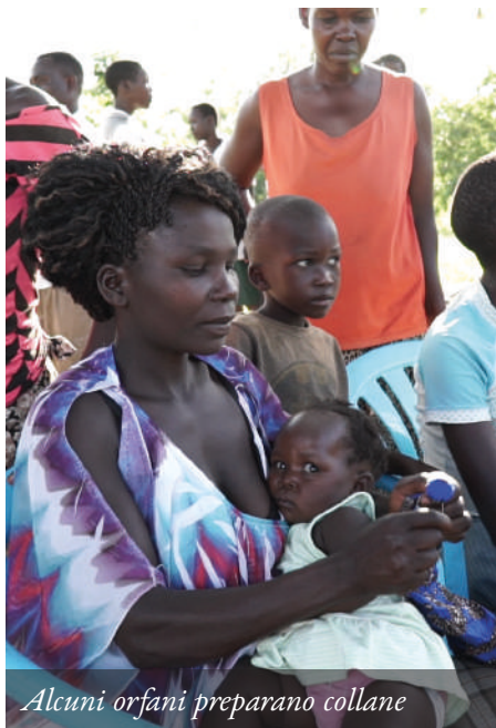
Alcuni orfani preparano collane