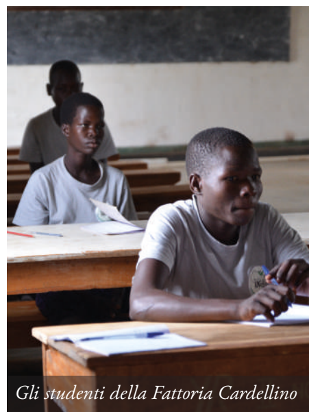
Gli studenti della Fattoria Cardellino

ze agricole e di strumenti, restano dipendenti dalle famiglie adottive. Vengono inclusi nel progetto didattico ambientale "Fattoria Cardellino", per fornire loro formazione tecnico-pratica, avviandoli così al mondo del lavoro e all'indipendenza.